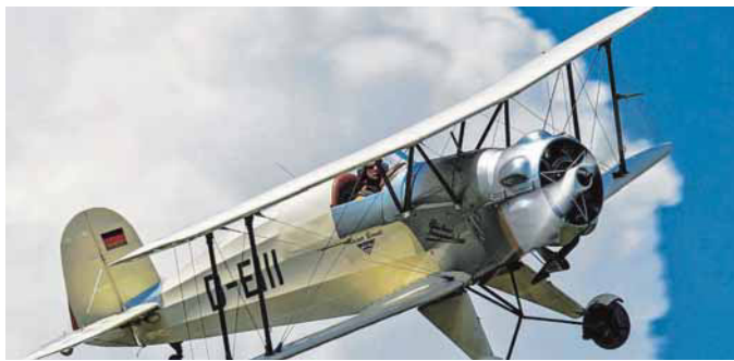
Oliver Heupel, Pilot einer Bucker, ist frisch gebackener Weltmeister im Oldtimer-Motorkunstflug.

Geboten werden Rundflüge, Kunstflüge und Vorführungen